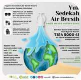
SEDEKAH AIR BERSIH