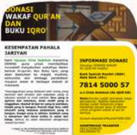
WAKAF QURAN & IQRO