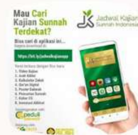
JADWAL KAJIAN SUNNAH INDONESIA